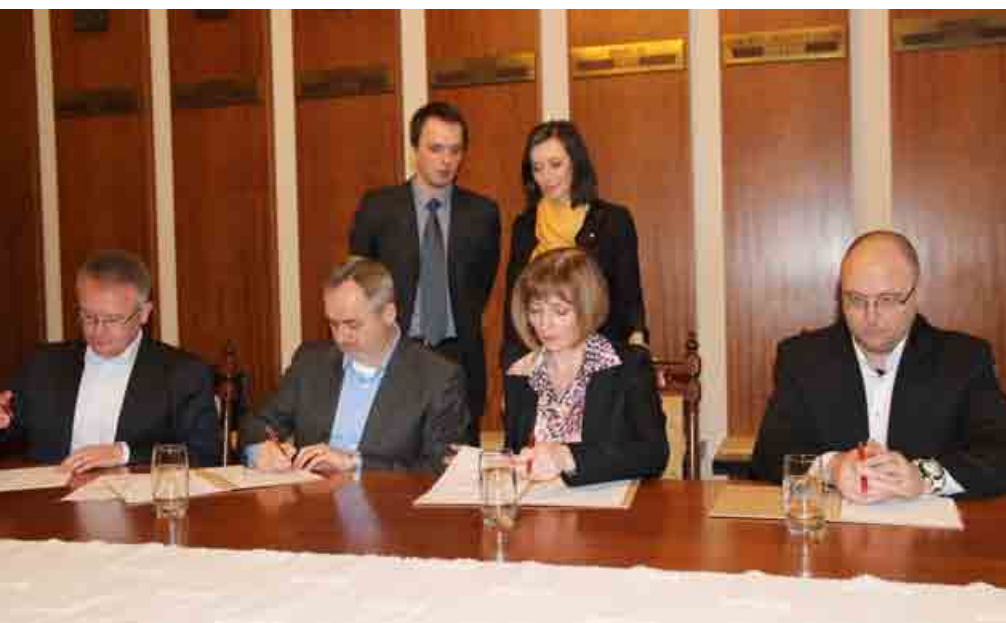
VSD začiatkom apríla potvrdila svoju aktívnu spoluprácu pri rozvoji mesta Prešov a príslušného regiónu.

Východoslovenská distribučná (VSD), člen energetickej Skupiny VSE/RWE, podpísala s mestom Prešov Memo-