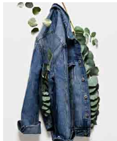
Okrem recyklácie starého oblečenia sa H&M zameriava aj na využívanie ekologickejších materiálov, napr. bio bavlny.

Mimoriadny boom v rámci modelu obehovej ekonomiky zažíva aj spoločné zdieľanie produktov a tovarov, tzv. sharing economy. Dnes na trhu pôsobí viacero firiem, ktoré ponúkajú zdieľanie áut. A majú úspech. Nemecká spoločnosť Car2Go, ktorá je poboč-