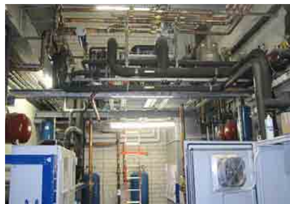
V 15 nových obchodných domoch Kaufland sa odpadové teplo z chladiacich zariadení spätne využíva na kúrenie a klimatizáciu, vďaka čomu obchodný reťazec redukuje emisie skleníkových plynov.

Hoci je rok 2015 na začiatku, v hlavnom meste pribudli už dve prevádzky Kaufland, a to začiatkom februára na Patrónke a koncom februára v Dúbravke. „Pri výstavbe nových obchodných domov dbáme na ochranu životného prostredia, preto naše prevádzky v Bratislave v Podunajských Biskupiciach, na Patrónke i v Dúbravke používajú na vykurovanie i chladenie namiesto konvenčných vykurovacích kotlov technológiu tzv. rekuperácie. Pri nej súbor chladiacich zariadení obsahuje integrované tepelné čerpadlo,