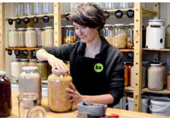
V bezobalovom obchode Bezobalu môžete najbližšie nakúpiť napr. v Prahe.

Takéto zdieľanie produktov a služieb má, okrem ekonomických a environmentálnych prínosov, za následok aj upevnenie vzťahov medzi ľuďmi. Vedie však i k rastu ekonomiky samotnej, čo by podľa januárovej správy Svetového ekonomického fóra mohla byť pozitívna informácia pre firmy, ktoré sa rozhodnú v budúcnosti uplatňovať model obehovej ekonomiky s cieľom správať sa na trhu ekologickejšie a racionálnejšie tak využívať dostupné zdroje. «