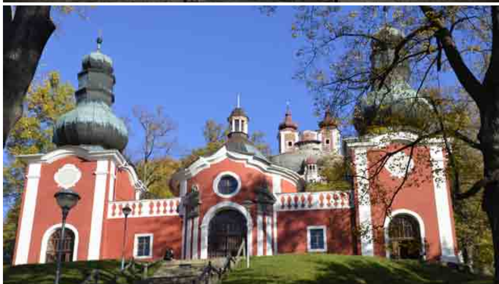
Banskoštiavnickú kalváriu turisti dnes neobchádzajú. S jej rekonštrukciou a obnovou začali miestni aktivisti pred siedmimi rokmi, aj vďaka spolupráci s Nadáciou VÚB.