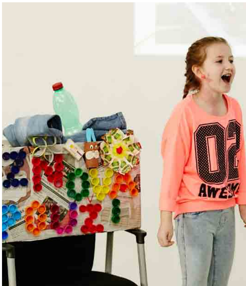
Embraco vedie žiakov materských a základných škôl k ochrane životného prostredia.

Siedmy ročník sa niesol v slávnostnej atmosfére. Tento program totiž pomohol Embracu získať už piate ocenenie Via Bona Slovakia , tentoraz v kategórii Dobrý partner komunity . «