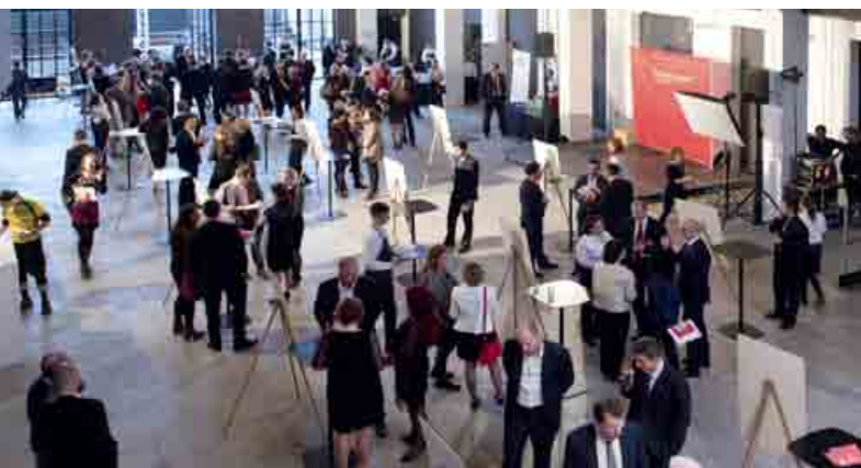
Samotnému odovzdávaniu ocenení Via Bona Slovakia za rok 2014 predchádzala prezentácia všetkých projektov, ktoré hodnotiace komisie v jednotlivých kategóriách posunuli do druhého kola.

Nadácia Pontis 26. marca 2015 udelila prestížne ocenenie Via Bona Slovakia firmám, ktoré dokazujú, že biznis sa dá robiť aj inak. Cenu získali za projekty a prístupy, ktoré sú niečím výnimočné, pomáhajú okolitej komunite, zamestnancom, berú ohľad na životné prostredie alebo bojujú proti korupcii a riešia spoločensky náročné témy na Slovensku. Víťazi idú pri svojom podnikaní nad rámec svojich zákonných povinností a snažia sa byť prínosom pre svoje okolie. Veríme, že ich príbehy budú inšpirovať aj ostatné firmy.